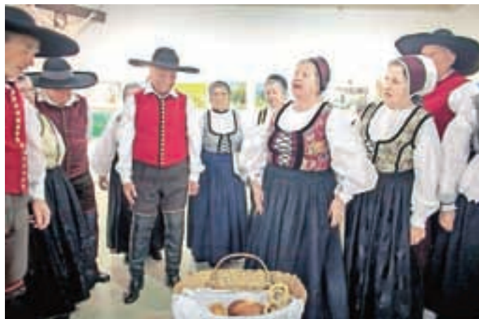
Kruha vseh vrst pa preste 'mamo tud!' (cehovski plesi)

Jubilej bodo v društvu praznovali na poseben način. Skupaj s KD Akademska folklorna skupina Ozara iz Kranja in OŠ Davorina Jenka Cerklje so pripravili medgeneracijski projekt Kmečka ohcet po starem. Skupine so namreč ugotovile, da bo odrska postavitev ljudskega običaja izzvenela še bolj prepričljivo in kvalitetno, če si generacije med sabo pomagajo in se dopolnjujejo, kot je včasih v resnici tudi bilo: starejši s svojimi izkušnjami in spominjanjem na stare čase, mlajši s svojim plesnim znanjem in veščinami, najmlajši – šolska folklorna skupina – pa s spontano radovednostjo in željo, da bi preteklost čim bolj spoznali. Seveda bodo vse skupine