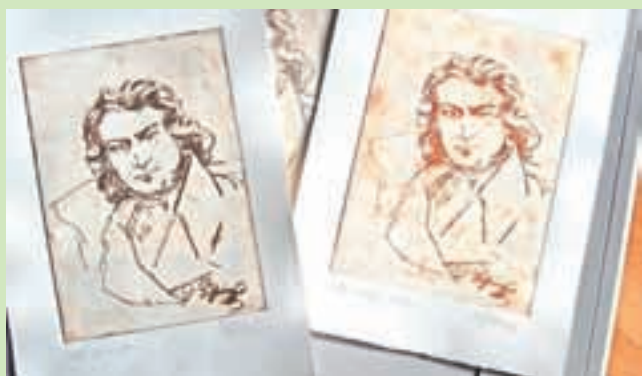
Grafike dr. Prešerina že tiskamo.