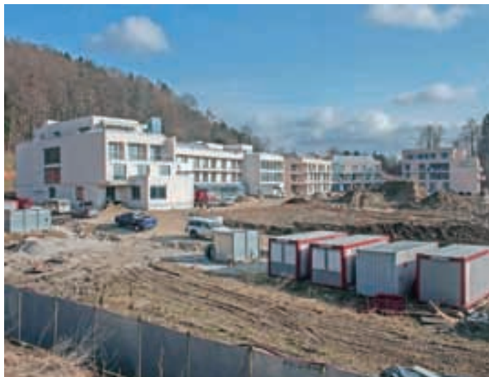
Dom starejših počasi dobiva končno podobo, prve stanovalce pa naj bi sprejel jeseni.

Na občini upajo, da jim bo država za dom starostnikov čim prej nakazala že odobrena sredstva in da bodo našli sposobnega direktorja. Dom naj bi prve stanovalce sprejel jeseni, razpis za sprejem pa bo objavljen marca.