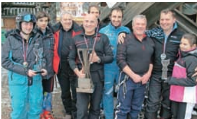
Najboljše tri ekipe (od leve): drugouvrščeni Meteor, zmagovalna ekipa Badrs in tretje uvrščeni Vargro