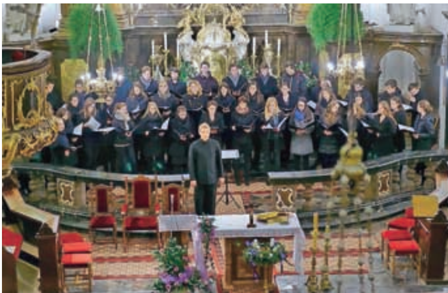
Zbor je navdušil številne poslušalce v župnijski cerkvi v Adergasu.