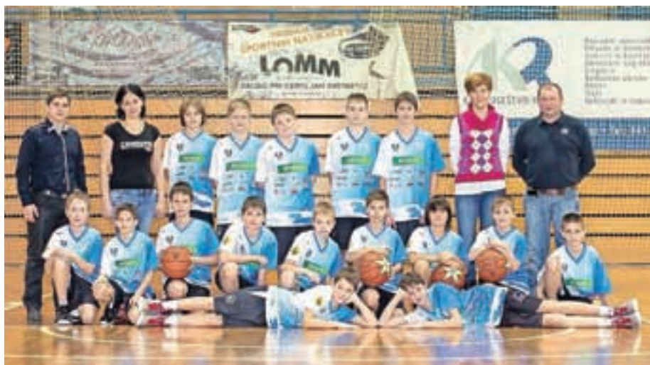
Ekipa Krvavec Tonač U-13 je zelo uspešna.

Pionirji Europcar Krvavec so letos še nepremagani: Hidria (78:48), Mesarija Prunk Seža-