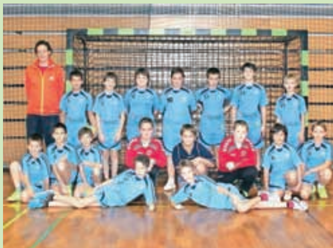
Mlajši dečki B

Vseeno pa se ozrimo malce nazaj v december, ko so starejši dečki RK Cerklje sodelovali na mednarodnem rokometnem turnirju v