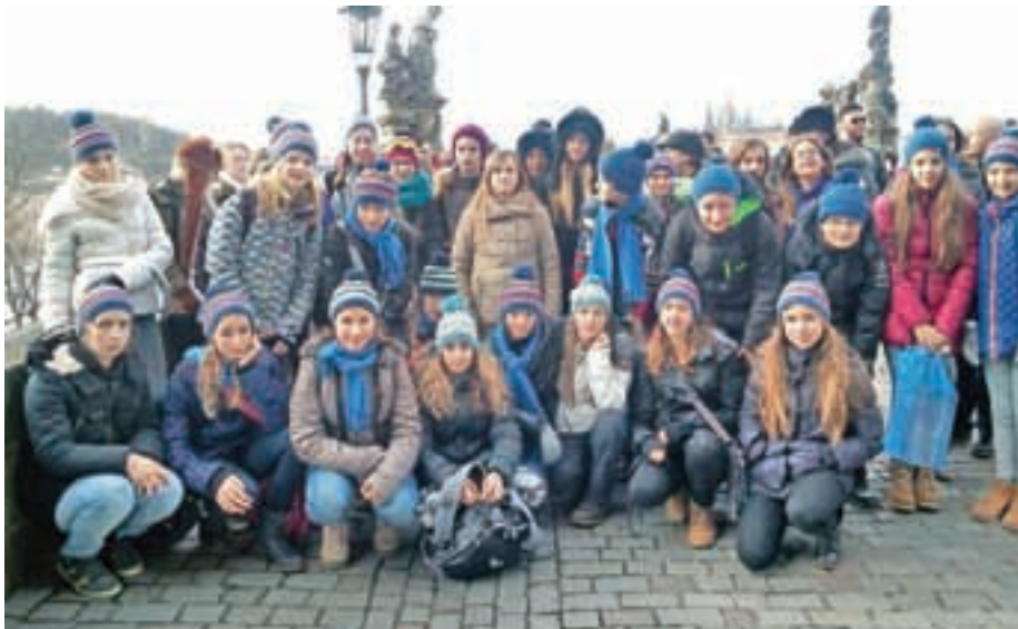
Skupinska slika na znamenitem Karlovem mostu v Pragi

Na OŠ Davorina Jenka nameravajo z gimnazijo v Nachodu sodelovati tudi v prihodnje,